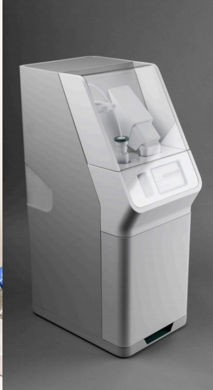
DTL Projekt 2016